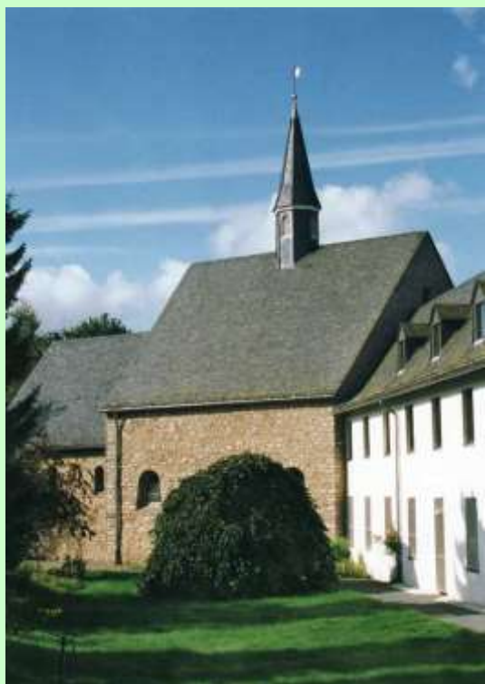
Benediktinerinnen-Abtei Kloster Steinfeld