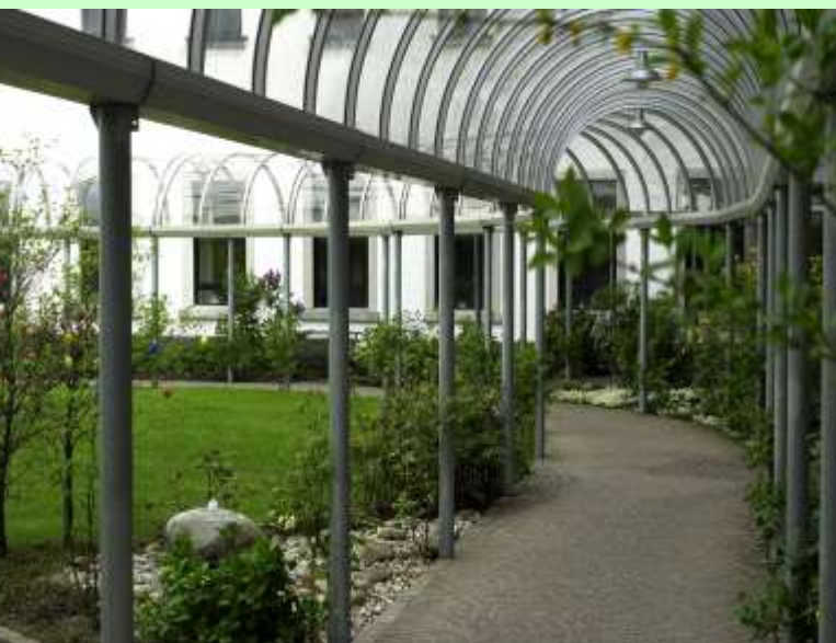
Mutterhaus der Armen-Schwestern vom Heiligen Franziskus, Aachen